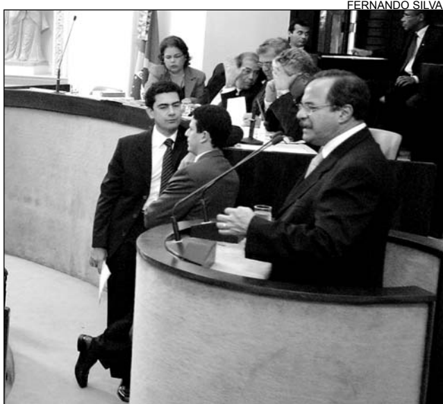
VIOLÊNCIA - Tucano questionou forma de combate

"Não ficou constatado que algumas dessas pessoas sejam infratoras. A Secretaria deve se preocupar em combater a criminalidade e não, perder tempo com aqueles que es-