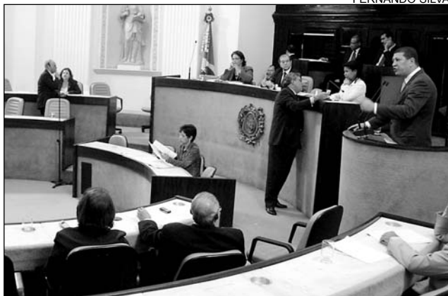
RECIFE - Grupos se concentram em frente à Celpe

O País inteiro realiza, no dia 7 de setembro, data em que se comemora a Independência do Brasil, uma série de manifestações, a fim de abordar temáticas referentes às contradições socioeconômicas. Este ano, a movimen-