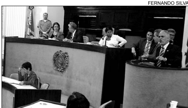
LEITE - Prazo para conclusão de processos pode expirar

De acordo com Leite, o TCE vem investigando há cinco anos e o prazo para a conclusão dos processos pode expirar. "A instalação da CPI contribuiria com a aceleração das investigações. Caso contrário, os responsáveis podem ficar impunes", alertou. As denúncias apontam que o empresário Fábio