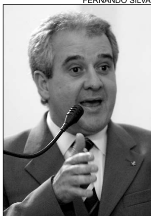
LICITAÇÃO - 113 dispensas

"No caso da Telemar, a assessoria de imprensa da Prefeitura alegou que ela é a