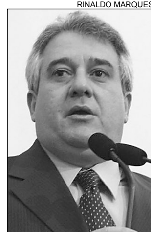
OPOSIÇÃO - Coutinho

No texto veiculado, o conselheiro do Tribunal de Contas do Estado (TCE) e relator do processo que julga a dispensa de licitação para contratar a Vital Engenharia ,