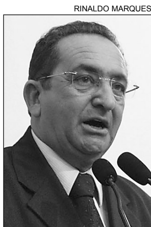
ALERTA - Bringel

De acordo com Bringel, nas 24 horas de ontem, o Corpo de Bombeiros registrou 36 ocorrências relacionadas a presença de animais