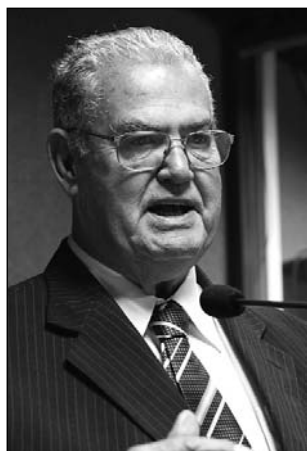
OTIMISTA - Coelho

Na 19ª edição, a Fenagri realizou o 1º Simpósio Internacional de Vitivinicultura, apresentando um ciclo de palestras e debates que envolveram aspectos ligados ao manejo de produção,