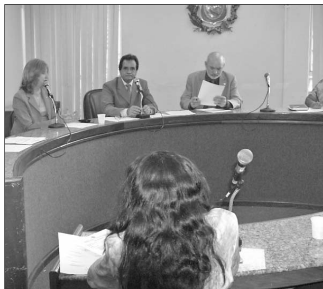
AGOSTO - Ciências e Tecnologia anunciou novos desafios

"O Programa vai fornecer para a sociedade alternativas de preservação do meio ambiente, já o Pólo Tecnológico terá como objetivo profissionalizar pessoas, no Agreste pernambucano, para atuarem no setor têxtil", explicou San-