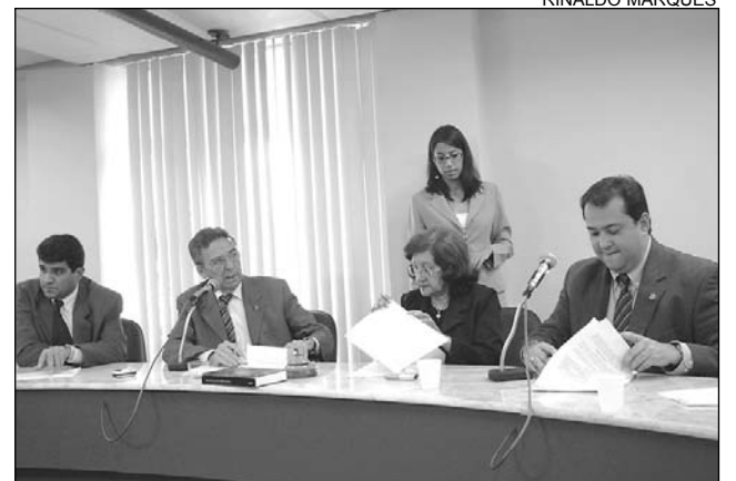
ECONOMIA - Iniciativa visa incrementar setor