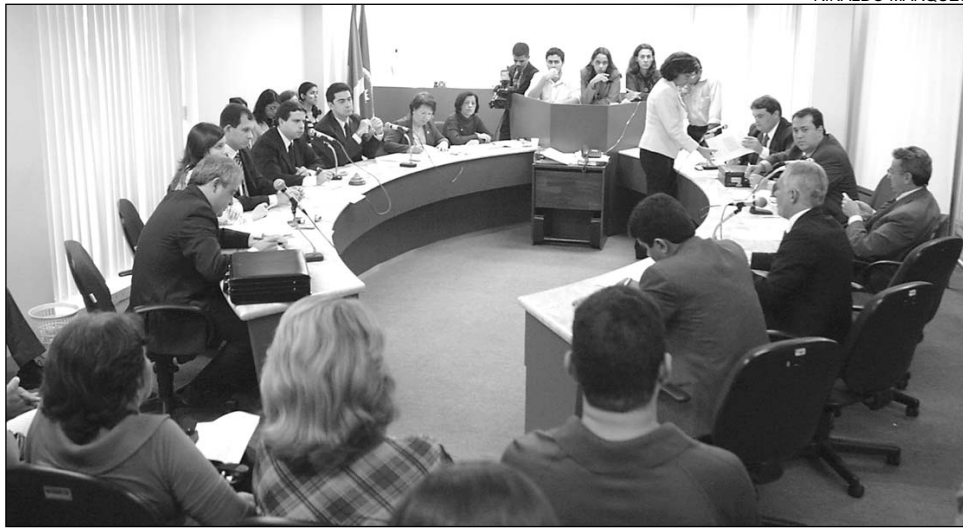
FUNDAC - Proposta que beneficia menores infratores também foi acatada pelo colegiado