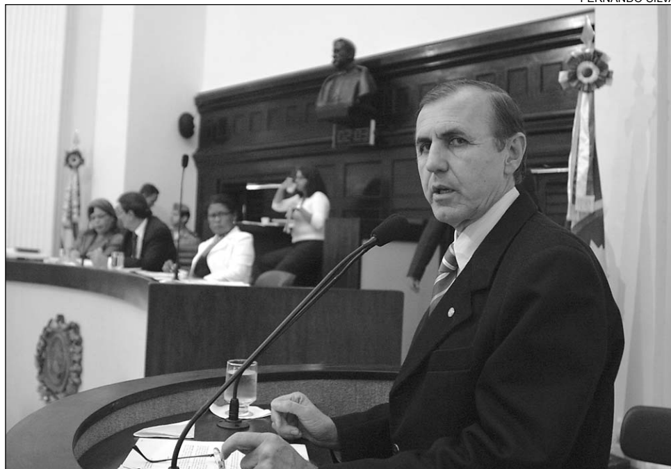
PREFEITURA - Abertura oficial aconteceu no último final de semana com várias atrações

O parlamentar destacou os esforços do presidente da Fundação de Cultura de Caruaru, José Seródio, do prefeito Tony Gel (PFL) e do governador Mendonça Filho (PFL) para garantir o êxito da festividade. Estima-se que aproximadamente 1,5 milhão de pessoas visitem a cidade durante o São João, onde cerca de oito mil empregos diretos e indiretos são gerados. "É uma festa que mobiliza não só a população de Caruaru,