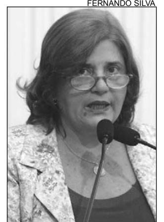
ANA - Empenho destacado

"O Governo ficará responsável pela reforma do prédio, enquanto a Prefeitura fará a aquisição e instalação dos equipamentos e a manutenção da unidade", explicou, acrescentando que o projeto deve ser concluído até o final do ano. A parlamentar destacou o sacrifício que colocava em risco a vida das