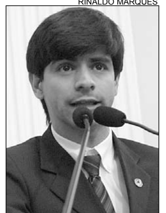
DENÚNCIA - Airinho

Segundo o socialista, o respeito aos lugares destinados às pessoas com problemas de locomoção e a fiscalização mais efetiva do Estado são os primeiros passos para garantir a acessibilidade. "Temos a obrigação de verificar se as leis estão