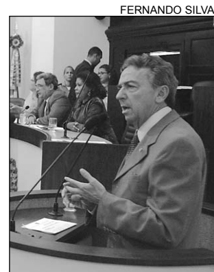
DECISÃO - "Demora"

"As denúncias apresentadas foram comprovadas com uma coleção de fitas cassetes, DVDs, CDs e fotos que evidenciam o abuso de poder político e eco-