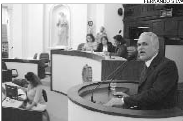
NÚMEROS - Idéia é ter acesso aos homicídios, por exemplo

Leite classificou a atitude do governador de "equivocada" e disse que vai mobilizar os deputados para derrubar os vetos. "É preciso que a lei seja implantada integralmente", frisou, esclarecendo