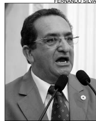
BRINGEL - Escassez de PMs

"Os municípios interiores, principalmente os sertes-