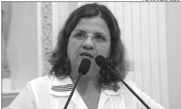
PETISTA - O Governo está negociando com o sindicato