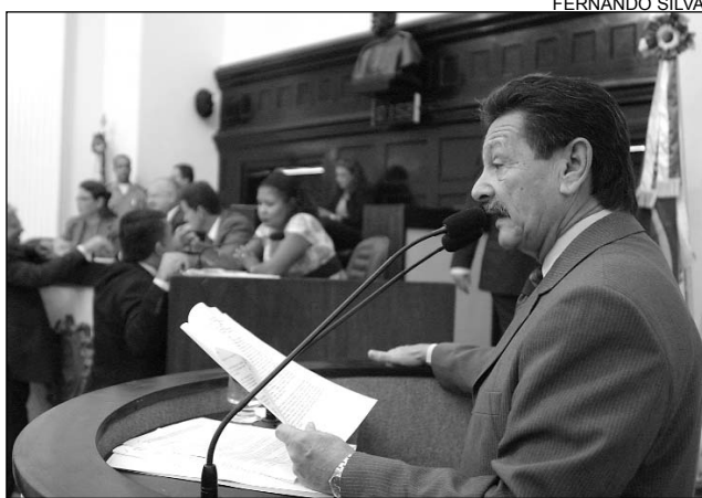
ALVES - Fatos históricos vão alavancar turismo do Estado

Criar uma estrutura de visitação em diversos pontos da cidade, nos quais o turista possa receber informações, foi defendida por Alves. Os Montes Guararapes, o Forte das Cinco Pontas e o acervo de arte barroca existentes no Estado são algumas das sugestões. "Em outros países,