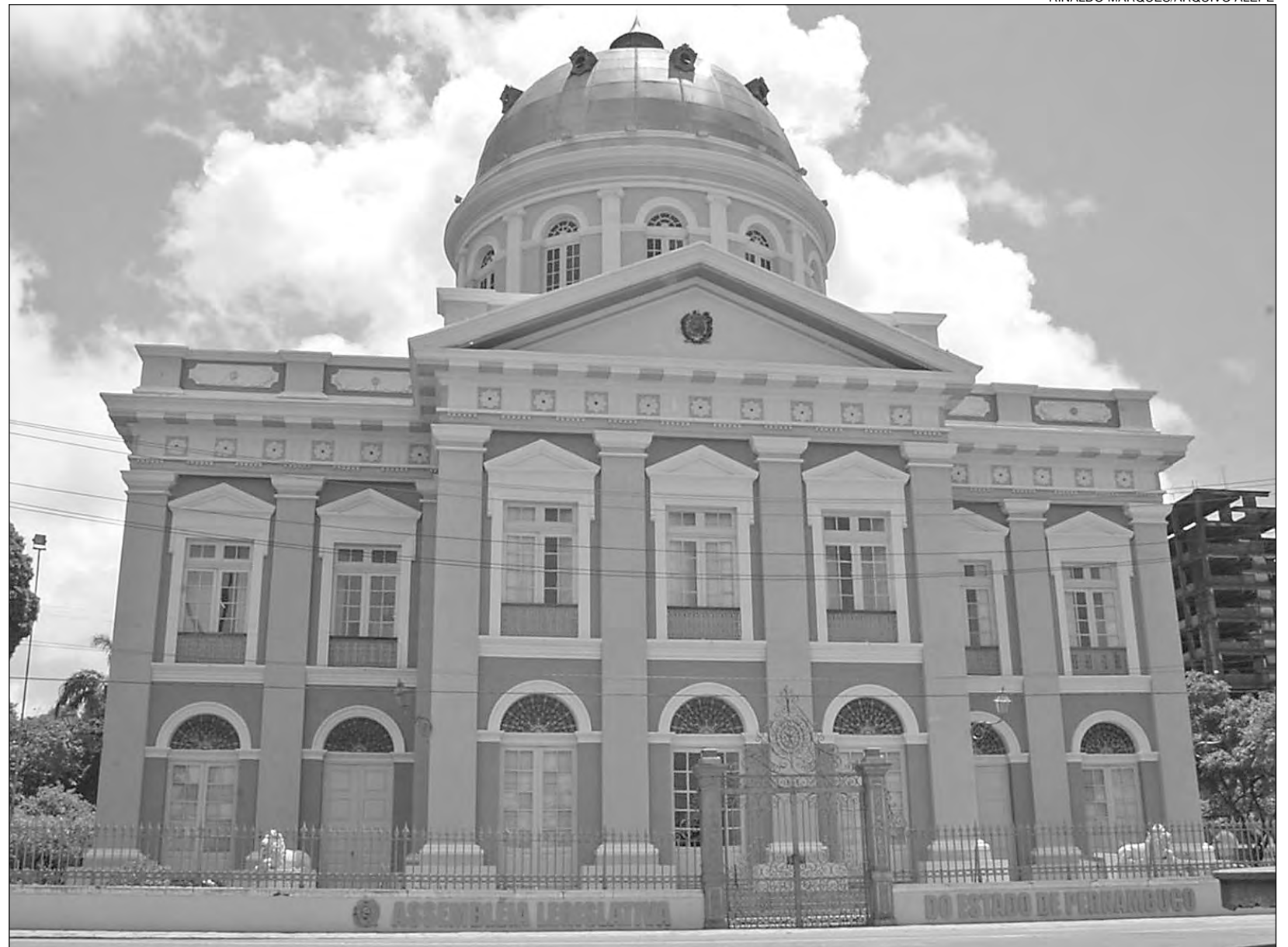
PALÁCIO – Depois da tramitação e aprovação em redação final na Alepe, projetos seguem para a sanção do governador Eduardo Campos (PSB)

Ainda durante o período extraordinário, o Projeto de Lei nº 1.779/11, de autoria da Comissão de Finanças, Orça-