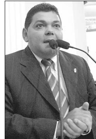
FIGUEIRÔA - Destaque parlamentar.

O prêmio é concedido a prefeitos e administradores regionais que tenham implantado projetos de estímulo ao surgimento e ao desenvolvimento de micro e pequenas empresas, "contribuindo, assim, para o crescimento econômico e social dos municípios", frisou o