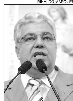
IMPACTO - Internacional

Moraes sugeriu que os delegados não recebam mais presos, se não tiver onde colocá-los. "Que o preso seja devolvido por ofício ao juiz de Execução Penal e o magistrado que resolve a situação", propôs, acrescentando que, se não existem vagas e