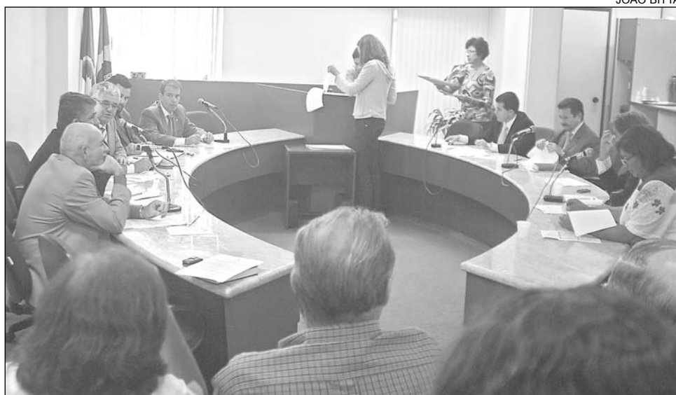
JOÃO BITTA FINANÇAS - Parlamentares aprovaram 292 emendas na íntegra e 80 com modificações

O Orçamento Fiscal do Estado estima receitas na ordem de R$ 13,2 bilhões para o ano de 2008. Desse montante, R$ 9,7 bilhões são provenientes do Tesouro e R$ 3,5 bilhões se originam de receitas de outras fontes. Na LOA, estão previstos os programas e as ações do Executivo para o próximo exercício seguindo o que está estabelecido no Programa de Governo e o