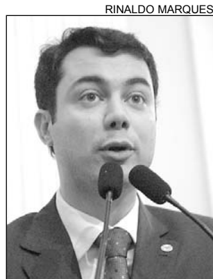
AUTORIA - Clodoaldo

Atualmente, potenciais doadores, a exemplo de indústrias, restaurantes, merca-