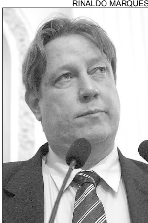
CRISE - Superlotação

ocupa o perímetro urbano. "Isso causa transtornos diá-