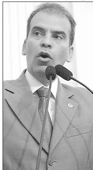
TRÂNSITO - Feitosa

Segundo o parlamentar, a estrada fica quase intransitável com a chegada do inverno, prejudicando agricultores e comerciantes daquela região. "Cerca de 30 ônibus saem todos os dias, carregados de banana, para abastecer o Centro de Abastecimento Alimentar (Ceasa), no Recife, e outras cidades do Nordeste", argumentou, acrescentando que várias famílias do comércio local vivem dessa atividade.