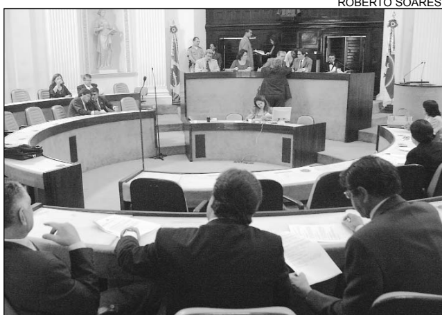
UNÂNIME - Matéria será rediscutida em março de 2006

Na ocasião, serão discutidas as bases salariais dos funcionários de níveis