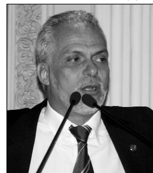
JC - Matéria foi elogiada

Leite disse, ainda, que os policiais estão desmotivados pela falta de incentivos e de perspectivas profissionais. "Para complementar o salário, muitos têm que ampliar a jornada de trabalho e fazer bicos", afirmou, acrescentando que a situação favorece à criminalidade. "Os marginais confiam na impunidade e na ineficiência do Estado".