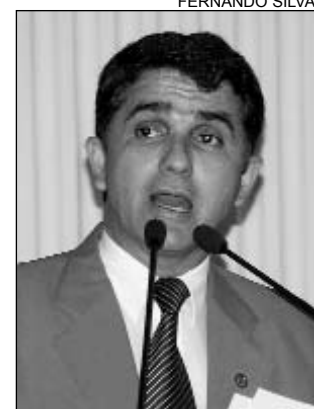
MOISÉS - Apoio ao soldado