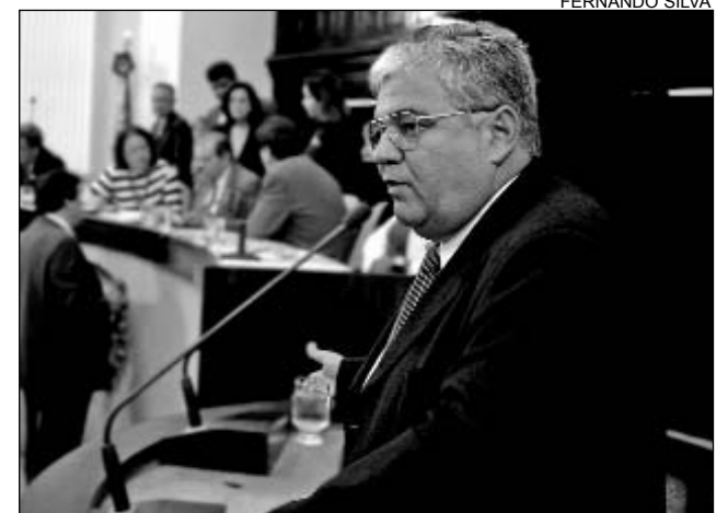
MORAES - Data será celebrada no próximo dia 11

os recursos para a execução das obras foram garantidos no Orçamento Geral da União (OGU) pelo senador Sérgio Guerra (PSDB/PE). "Os R$ 3 milhões ainda não chegaram aos cofres do município devido a débitos de R$ 15 milhões, deixados pelas administrações anteriores. Mas o prefeito da cidade está entrando na Justiça para garantir o envio das verbas", afirmou o deputado.