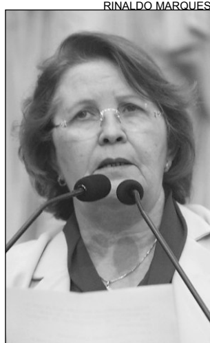
JACILDA - Fora, Sarney

A parlamentar destacou a trajetória do político do Rio Grande do Sul, que tem cerca de 40 anos de vida pública e ocupou os cargos de vereador, deputado estadual, governador e ministro da Agricultura. “Os brasileiros admiram a atuação comprometida e a experiência de Simon, que passou por vários mo-