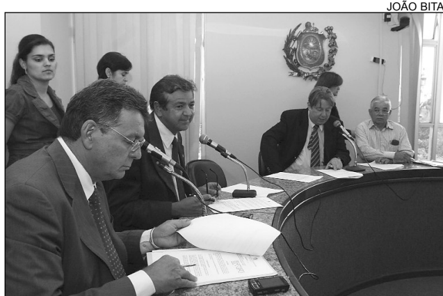
ADMINISTRAÇÃO - Aprovado substitutivo da CCLJ

De acordo com o texto, os assentos deverão estar situados em local de fácil acesso e boa visibilidade e ser identificados preferen-