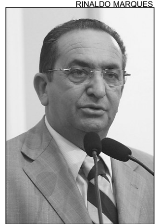
BRINGEL - Na comitiva

Em Bodocó, o debate foi sobre o fortalecimento da Baía Leiteira e, em Trindade, Guerra se comprometeu a atender Organizações Não-Governamentais (ONG) em projetos sociais e econômicos.