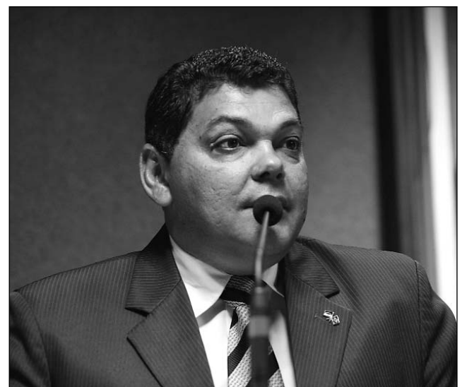
ALEGRIA - Figueirôa exaltou decisão do Executivo

ção paraibana e melhorar o acesso ao Pólo de Confeções", disse o petebista. A adutora e a pavimentação da PE-160 são antigas reivindicações do parlamentar.