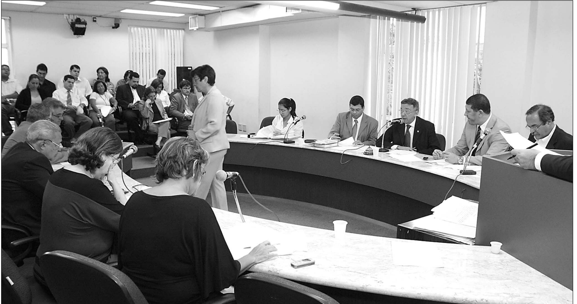
CENTRO DE FORMAÇÃO - Uma das propostas visa retomar os investimentos na Fábrica Cultural Tacaruna, localizada no limite entre as cidades do Recife e de Olinda