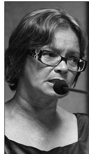
SUS - Balanço das ações

"O sistema tem permitido resultados inquestioná-