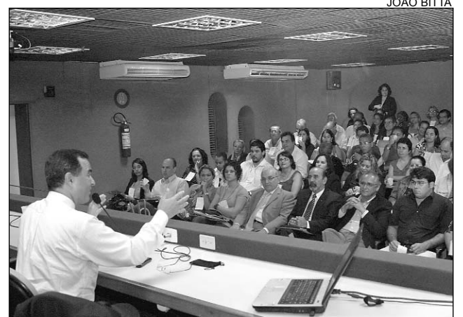
DESAFIO - Proposta visa conscientizar sociedade