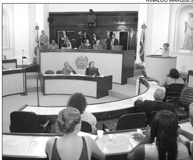
POESIA - Na tribuna, atriz decantou desafio da profissão