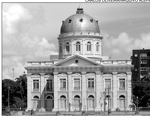
AURORA - Palácio Joaquim Nabuco integra paisagem

A celebração será concluída com um show pirotécnico de cinco minutos, também na Rua da Aurora. Na sequência, parlamentares, servidores e convidados irão para o pátio do Anexo III da Alepe, onde haverá o corte do bolo de aniversário. A solenidade não foi realizada no dia 1º de abril devido ao feriado da Semana Santa.