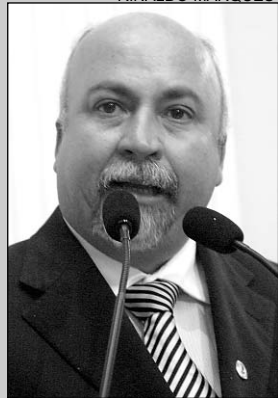
HISTÓRIA - Lembrança