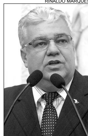
ALERTA - Fiscalização

Segundo o parlamentar, em vez de progredir, o Brasil está voltando à época de conhecido e lamentável lema do governador Aderival de Barros: "Eu roubo, mas eu faço". "É importante fiscalizar e cobrar que as pessoas assumam os erros", enfatizou.