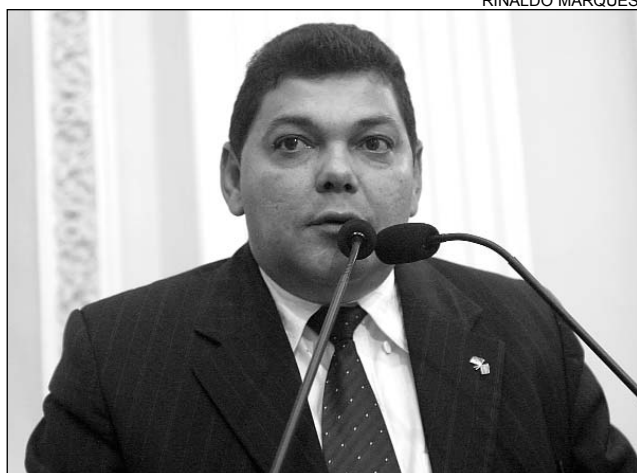
EXEMPLO - Figueirôa citou o Corpo de Bombeiros

O parlamentar falou, ainda, da mudança na tributação do ICMS para as empresas do Pólo de Confecções; a inauguração da Ponte de São Domingos; a reforma da PE-160, que liga Pão de Açúcar ao Santa Cruz Moda Center; e a interligação da Adutora de Jucazinho à de Tabocas. "Os benefícios contribuem para o desenvolvimento não apenas de Santa Cruz do Capibaribe, mas de todos os municípios da região", destacou.