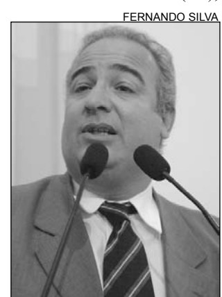
CIRO - Faltam explicações