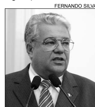
MORAES - Internet

Para o tucano, o Governo Federal deveria investir na transmissão das audiências via Internet. Assim, diminuiriam gastos e aumentaria a segurança das testemunhas.