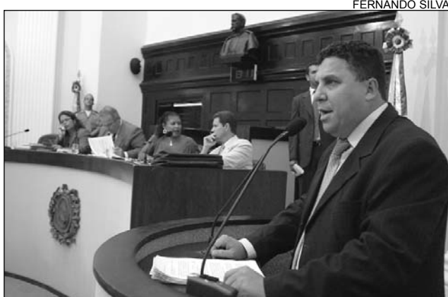
RESPOSTA - Críticas de prefeito de Jaboatão são rebatidas