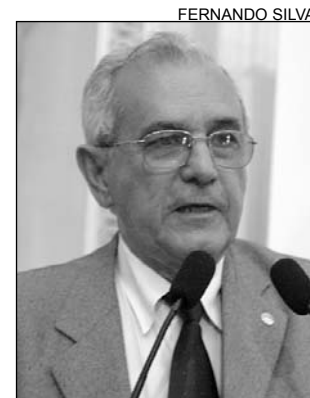
MAVIAEL - Redução

Segundo Cavalcanti, os defensores dos direitos humanos devem proteger quem necessita de cuidados e não os que praticam violência. "A própria Constituição reconhece aos maiores de 16 anos e menores de 18 anos lucidez e discernimento na tomada de decisões ao lhes conferir capacidade eleitoral ativa", argumentou.