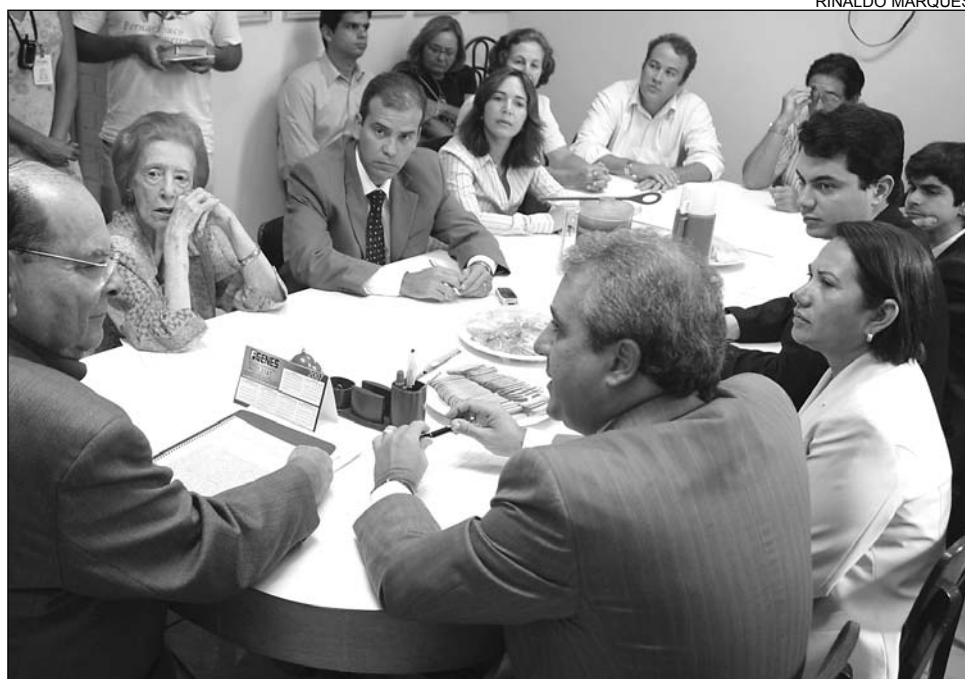
ESFORÇO - Parlamentares se reuniram com a direção da unidade e deram sugestões

De acordo com o presidente do Conselho Administrativo do Hospital,