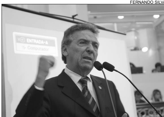
PESP-PE - Debate marcado para os próximos dias 24 e 25

Queiroz afirmou que, apesar dos obstáculos, o socialista vem fazendo um bom Governo devido à afinidade política com o presidente da República, Luiz Inácio Lula da Silva (PT). Para o pedetista, o apoio federal pode facilitar a execução das propostas do Pacto pela Vida. O parlamentar lamentou a ausência da Assembleia Legislativa de Pernambuco (Alepe) no colegiado forma-