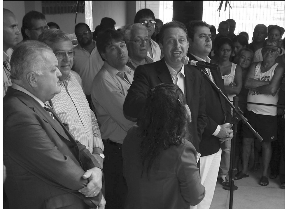
QUALIDADE - Eduardo Campos ressaltou investimentos feitos no sistema educacional