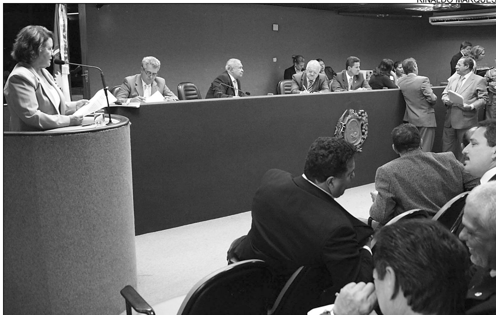
ANÁLISE- Deputada disse que moradores da Cidade Alta e arredores são mais prejudicados

Peemedebista disse estar preocupada devido à proximidade do Carnaval