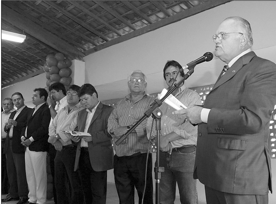
SABER - Presidente do Parlamento (D) falou sobre importância do conhecimento

Recife, sexta-feira, 6 de fevereiro de 2009