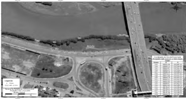
CROQUI DA ÁREA DE PRESERVAÇÃO PERMANENTE ONDE OCORRERÁ A INTERVENÇÃO