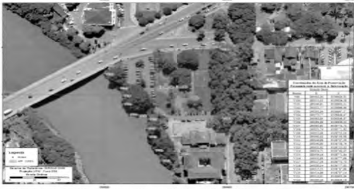
CROQUI DA ÁREA DE PRESERVAÇÃO PERMANENTE ONDE OCORRERÁ A INTERVENÇÃO