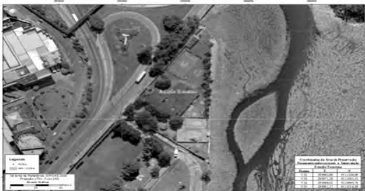
CROQUI DA ÁREA DE PRESERVAÇÃO PERMANENTE ONDE OCORRERÁ A INTERVENÇÃO