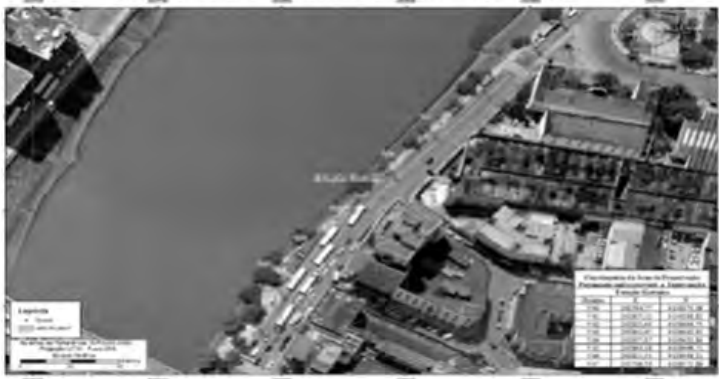
CROQUI DA ÁREA DE PRESERVAÇÃO PERMANENTE ONDE OCORRERÁ A INTERVENÇÃO