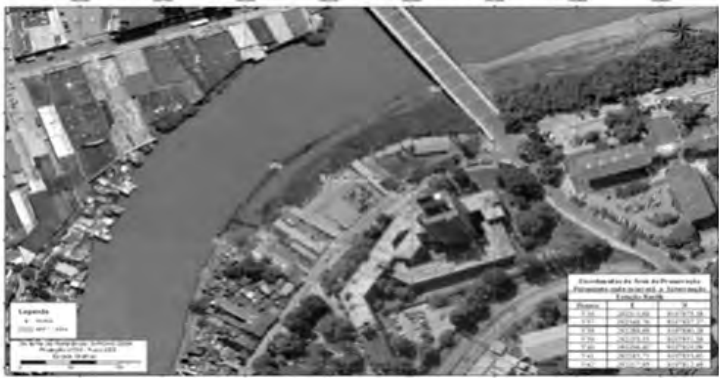
CROQUI DA ÁREA DE PRESERVAÇÃO PERMANENTE ONDE OCORRERÁ A INTERVENÇÃO