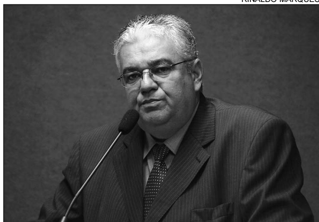
CÓDIGO PENAL - Tucano diz que crime foi culposo

Moraes disse entender a revolta da família e da so-