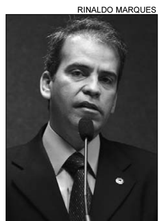
FEITOSA - Iniciativa

Feitosa também parabenizou o comandante do 21º