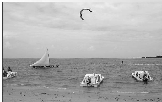
PARAÍSO - Desativação vai promover desenvolvimento