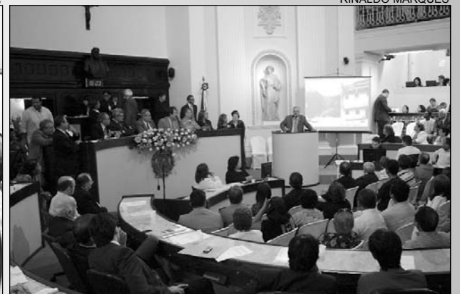
ILHA - Uchoa (d) apresentou potencial turístico de Itamaracá