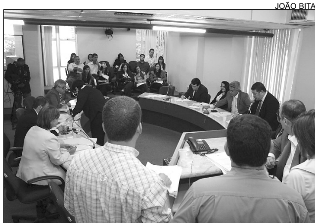
UNANIMIDADE - Empresas deverão orientar consumidores

que, além de preservar o ecossistema, a ideia é defender a saúde humana. “É preciso criar meios de descarte que obedeçam aos cuidados especiais exigidos no manuseio dos produtos. Uma vez lançados no lixo das residências, estabelecimentos comerciais e industriais e, por fim, nos lixões dos municípios ou em aterros, esse material acaba contaminando o solo, os lençóis freáticos e as plantações de alimentos”, justificou.