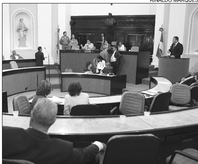
TRIBUNA - Nascimento comentou relevância do gesto

Nascimento considerou “nobre” a atitude dos familiares e criticou políticos que “aproveitaram essa tragédia e as mortes de outros advogados para condenar a atuação do Governo do Estado”. O líder lembrou a realização de uma audiência pública, na qual diversos segmentos e representantes da