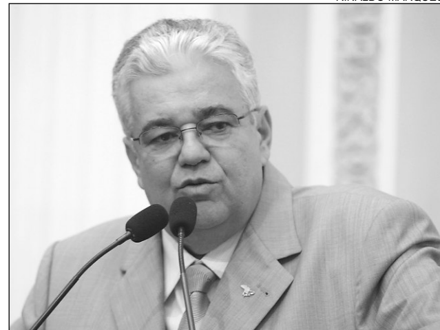
MORAES - Apoio ao religioso que substituirá Dom José

O religioso, que também foi auxiliar de Dom José, no período de 2000 a 2005, tem 62 anos e é natural do Cabo de Santo Agostinho, Região