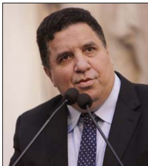
CELEBRAÇÃO - Município teve o povoado fundado em 1593

“Parabenizo Jaboatão e todo seu povo guerreiro, trabalhador e acolhedor”, disse o deputado. No mesmo discurso, o parlamentar elogiou o trabalho promovido pelo movimento Mães contra o Crack, em Pernambuco. “Que-