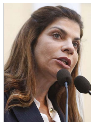
SUGESTÃO - Remanejamento de verbas de emendas parlamentares