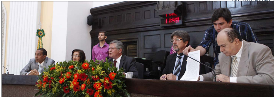
INICIATIVA - Proposta prevê a afixação de cartaz informativo em instituições públicas e privadas

A proposta foi aprovada com a adição da emenda nº 01/2016, da Comissão de Justiça, que incorporou o texto da proposição à lei já existente sobre o assunto. A justificativa da matéria explica que o objetivo da medida é “incentivar o contato direto com os conselheiros tutelares, por meio do número do telefone, para se conseguir mais efetividade no trabalho de