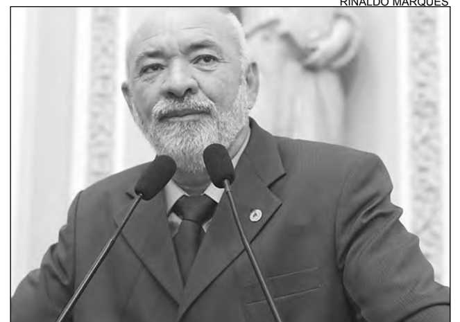
PREFEITURA - Republicano cobrou atenção ao gestor