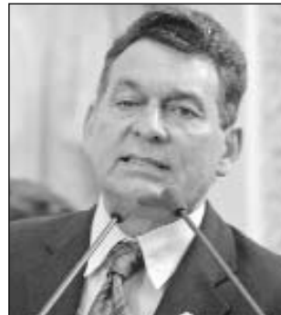
PRECONCEITO - Fim