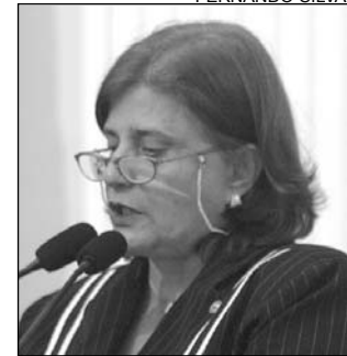
ANA - Povo guerreiro