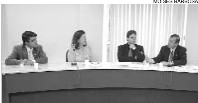
FUNDEB - Criação do Fundo estará na pauta de debate