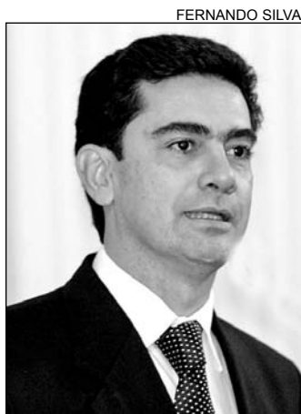
PIMENTEL - Proposição

Pimentel justificou a proposta em razão do fato de que nem o Regimento Interno da Casa nem a legislação federal tratam da cassação de Título de Cidadão. Segundo ele, é preciso