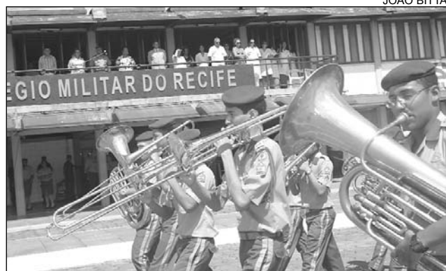
DESFILE - Alunos que integram a banda se apresentaram