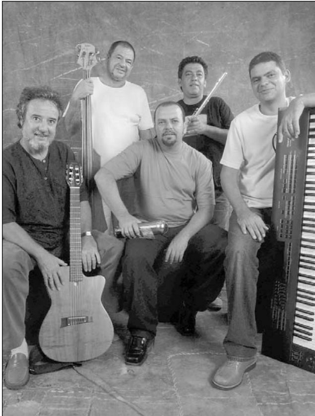
CARREIRA - Artistas estão no cenário musical há 35 anos