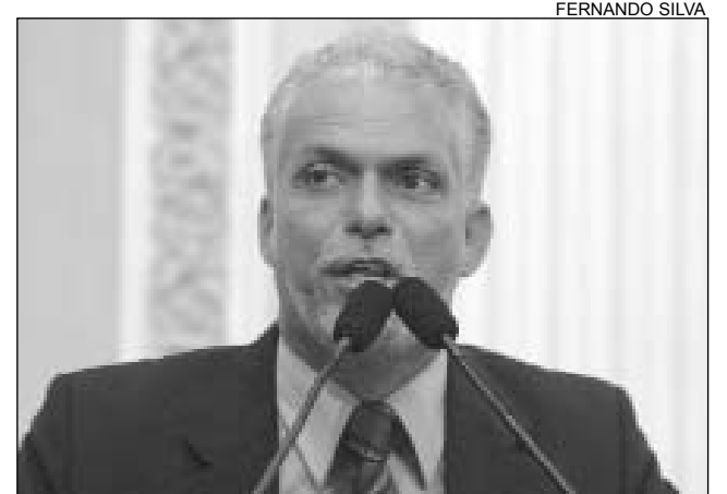
LEITE - Petista disse que "erros" já haviam sido apontados

O líder do Governo, Pedro Eurico (PSDB) criticou a Oposição "pela tentativa de criar uma linha divisória entre a gestão de Jarbas Vasconcelos e a de Mendonça Filho". "O Governo Jarbas foi transparente no reconhecimento dos avanços e das dificuldades. A prioridade do novo secretário é inibir a violência", destacou.