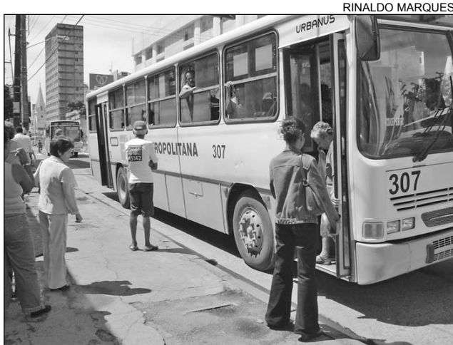
CONFLITO - Serviço oferecido à RMR é precário