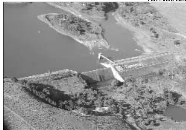
ABASTECIMENTO - Sistema deficitário nas cidades

elas Jucazinho e Prata, nada mais justo que Ta-