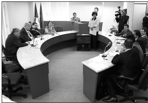
FINANÇAS E ADMINISTRAÇÃO - Colegiados realizaram ontem reuniões ordinárias

Para ter acesso aos espaços, os menores deverão estar acompanhados do pai, da mãe ou de um responsável. Segundo o projeto, ainda será criado um cadastro estadual de torcedores infratores e câmeras de vídeo deverão ser instaladas dentro dos estádios.