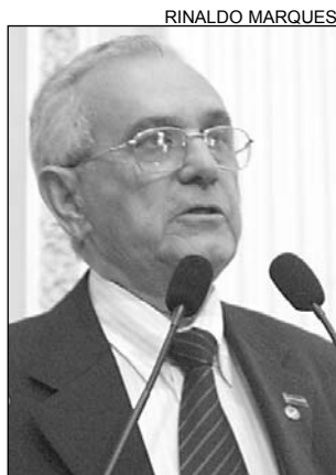
MAVIAEL - Debate