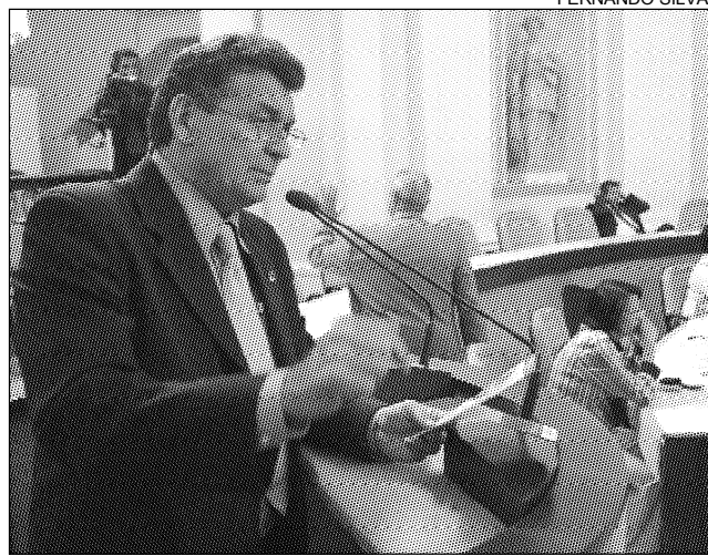
PÚBLICO - Entre 15 e 18 anos de idade serão beneficiados

"Tudo isso contribui para reverter o quadro de exclusão ao qual essa classe está submetida. O programa irá incluir a juventude do Recife em atividades com-