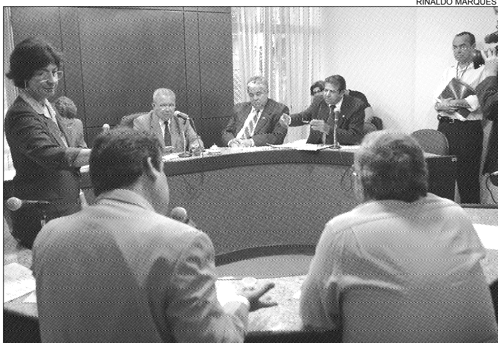
ACORDO - Representantes de vários setores foram ouvidos para solucionar questionamentos

Recife, sexta-feira, 4 de novembro de 2005