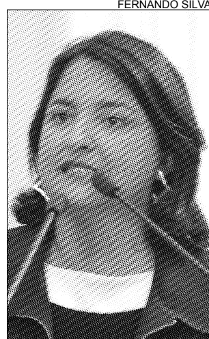
ANA - Destacou seminário

A progressista ainda registrou a realização do 24º Congresso Estadual de