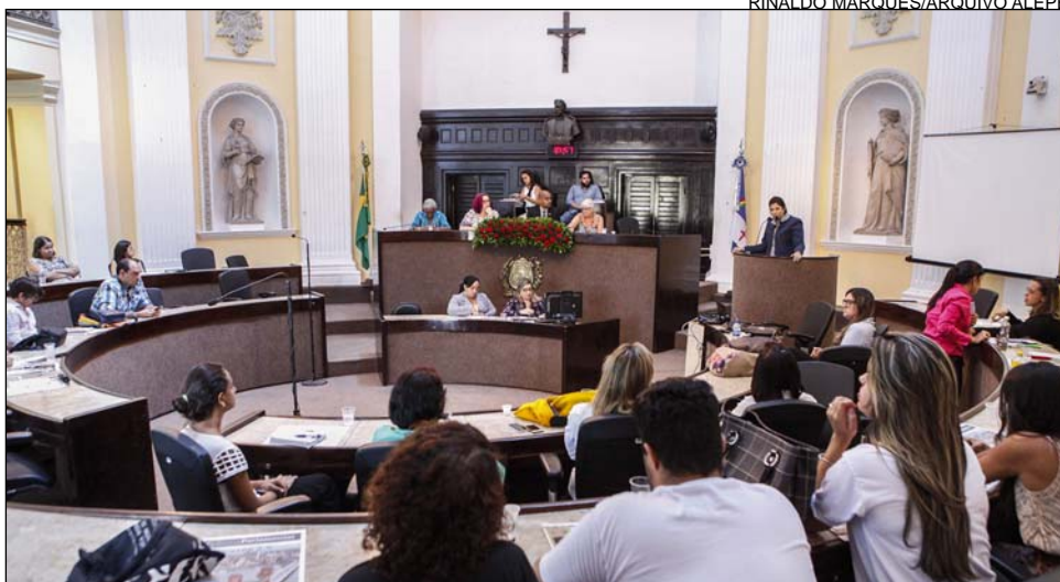
CONTRIBUIÇÃO - Audiência pública realizada pela Casa, em junho, enalteceu trabalho das profissionais