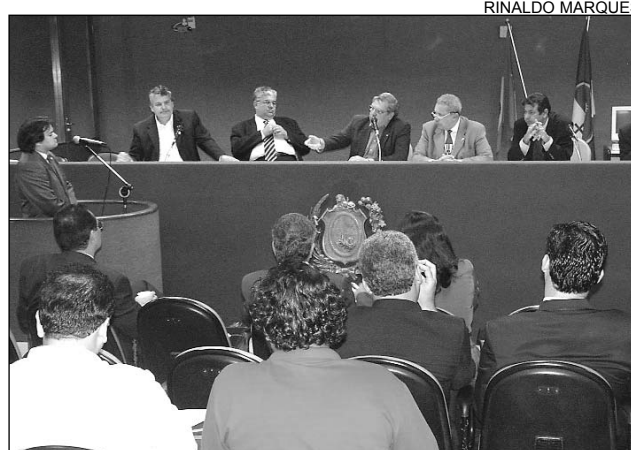
ALERTA - Estado sofre com escassez, apesar das barragens