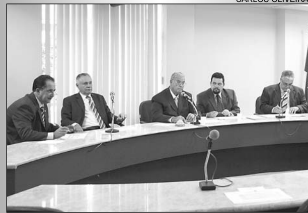
MAIO - Benefício para servidores será retroativo