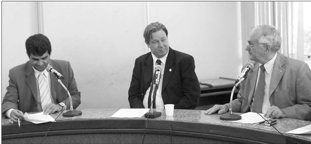
ANÁLISE - Parlamentares concordam sobre benefícios que a iniciativa trará para os setores turístico e sucroalcooleiro