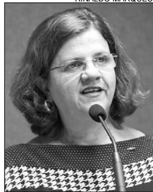
TERESA - Confiança

de Educação. Em 1973, outro decreto excluiu o MEC da planilha. De lá para cá, o financiamento da educação ora avança, ora recua. Em 1995, a educação sofreu dois duros golpes: vigorou o dispositivo desvinculando 20% das receitas de impostos para o setor e foi negado o Pacto Nacional pela Educação, estabelecendo um piso nacional para o Magistério", disse a petista, lendo o documento.