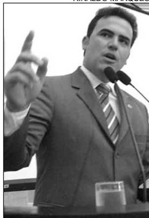
ELOGIO - Miguel Arraes

de um país melhor. Compartilho o que Campos ressaltou e acho que o PSB