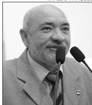
DESAFIO - São Caetano