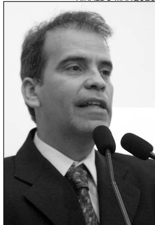
FEITOSA - Bem-estar

de futebol é possível contribuir com a formação de cidadãos, desenvolvendo o espírito de equipe, a coragem e o discernimento. Dessa forma, reduzimos a criminalidade e oferecemos aos jovens perspectivas de futuro", observou.