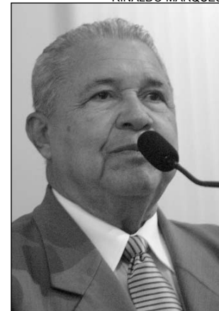
TRABALHO - Reconhecido