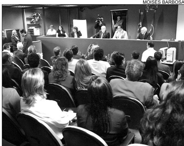
PRÉVIA - Seminário de apresentação aconteceu no dia 16/08

O segundo módulo tratará de Coligações e Alianças Políticas em Pernambuco, com o professor