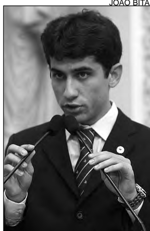
ELOGIO - Poder Executivo

De acordo com o parlamentar, a única norma vigente em Pernambuco regulando o transporte do queijo é a Lei nº 13.376/2007, artigo 9º, de 20 de dezembro de