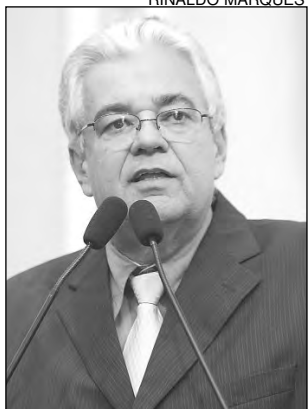
MORAES - Mais segurança