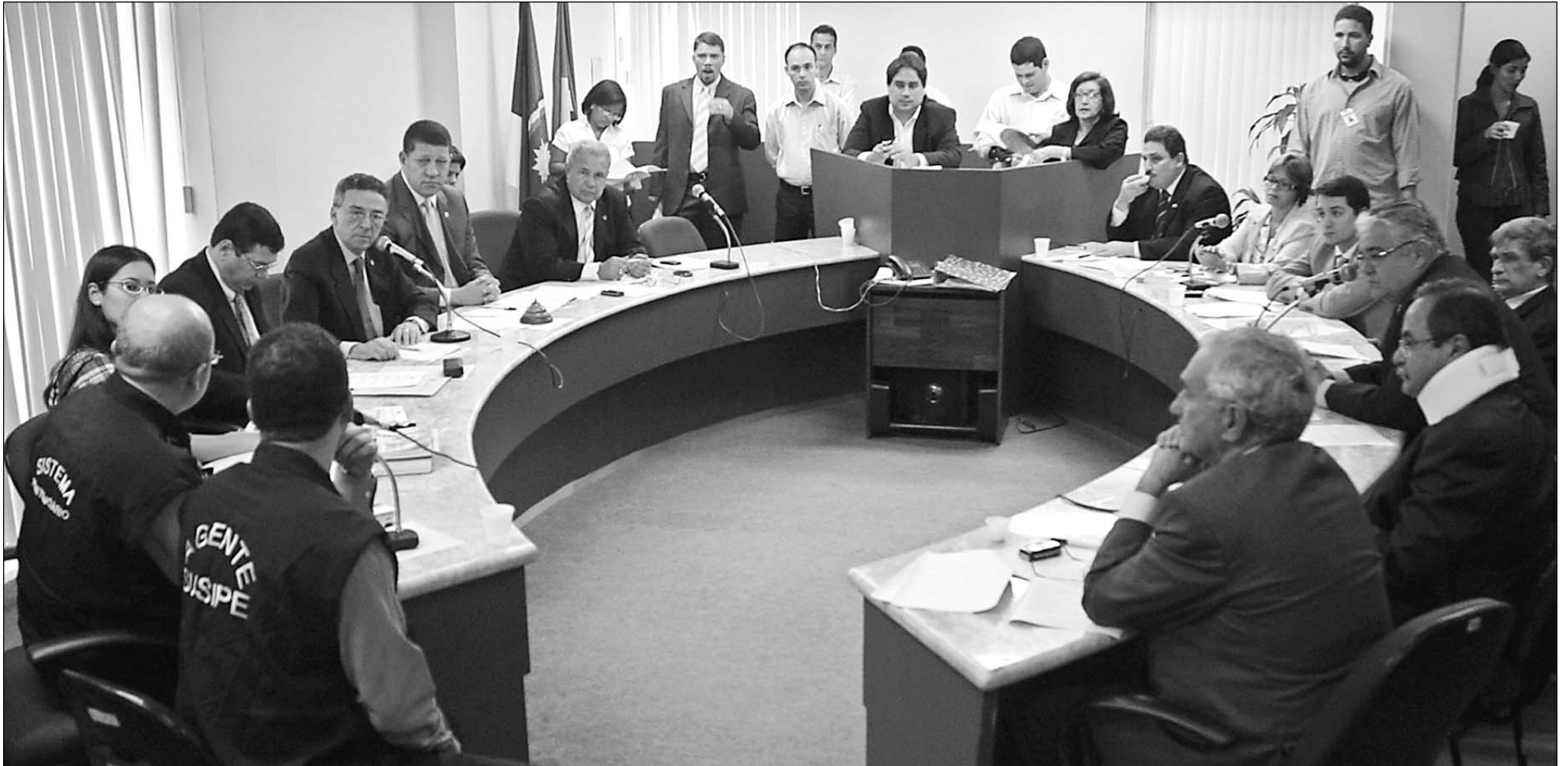
LEI SECA - Decisão do Governo Federal de proibir a venda e o consumo de bebidas alcoólicas nas BRs também motivou debate no colegiado, no mês de março