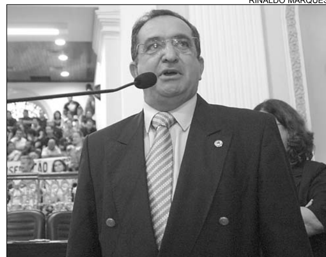
BRINGEL - Tucano fez alerta e cobrou providências

De acordo com o parlamentar, o motorista só percebe o perigo a poucos metros. A grande quantidade de carcaças de animais no asfalto dá a exata dimensão do problema. “Na semana passada, uma jovem estava em sua motocicleta, nas proximidades do município