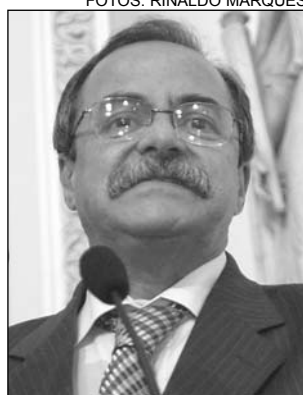
EURICO - Dívidas

nambucana no Congresso para ir ao MEC, a fim de conseguir, o mais rápido possível, a liberação de funcionamento”, frisou, acrescentando que o curso será o primeiro do Interior na área. A instituição integra as unidades de ensino que compõem o Instituto Tocantinense Presidente Antônio Carlos (Itpac).