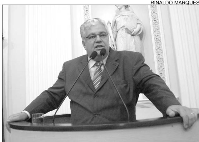
CONCURSO - Idéia é ajudar quem está se preparando

Vários telefones e pedidos de ajuda por e-mail de candidatos inscritos no concurso para ingressar na Polícia Militar foram recebidos pelo deputado Antônio Moraes (PSDB). Os candidatos protestam contra o projeto de Lei Complementar nº 498/2008, de autoria do Poder Executivo, que está tramitando na Alepe. A medida diminui a idade máxima para concorrer a cargos na Polícia e no Corpo de Bombeiros Militar, de 30 para 28 anos. O parlamentar expôs, ontem, no Plenário, o teor das reivindicações.