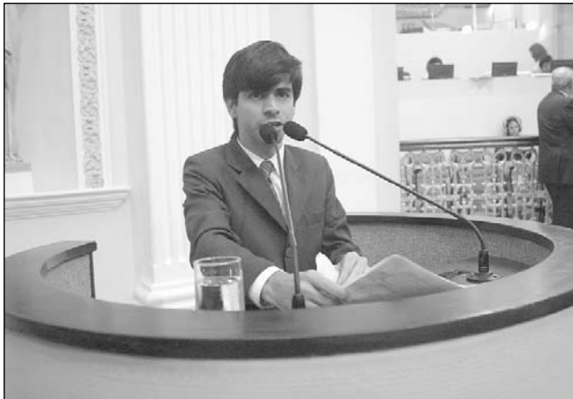
AIRINHO - Pedidos direcionados ao Sertão do Estado