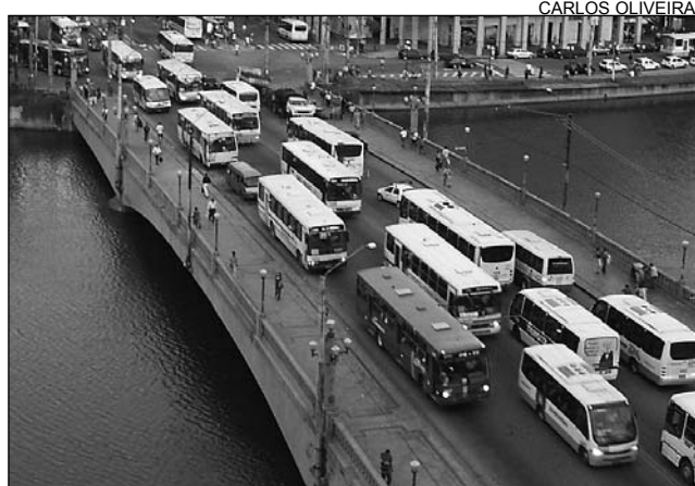
AUDIÊNCIA - Deputados vão discutir transporte público

No ano passado, o então governador Jarbas Vasconcelos (PMDB) encaminhou projeto autorizando a criação do consórcio. A matéria recebeu parecer das Comissões Permanentes, mas, como não houve a apreciação em Plenário, foi ar-