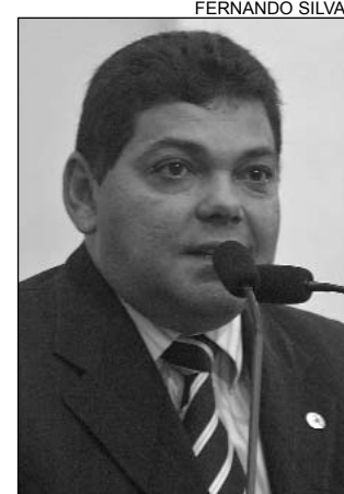
FIGUEIRÔA - Gratidão

Figueirôa também afirmou que já estão assegurados R$ 39 milhões para a duplicação de 51 quilômetros da estrada. O projeto facilitará o escoamento dos produtos do Pólo de Confecções do Agreste e garantirá mais segurança para os empresários