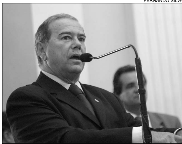
PARLAMENTAR - Apreensão com a quebra de hierarquia