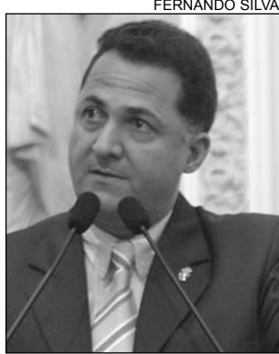
BARRETO - Alerta

De acordo com o parlamentar, o manancial abastece a população de municípios como Agrestina, Caruaru e Belém de Maria. "O reservatório é muito importante para a região. Possui 425 metros de largura e uma profundidade de 27 metros.