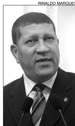
OBJETIVO - Midiático

"A temática da violência deve ser tratada nesses bairros não só no período eleitoral. Muitos dos que hoje estão descobrindo os problemas dessas comuni-