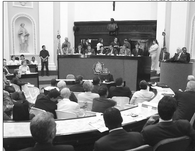
SUSPEITA - Entre as queixas contra a Celpe, a de coação

a Celpe paga propina a policiais civis, a fim de intimidar consumidores."