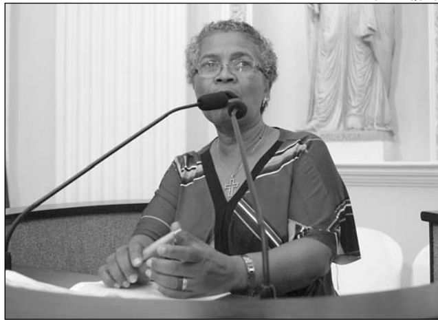
DECRETO - Deputada destacou importância da medida

Segundo a socialista, a implementação da reserva vem sendo debatida desde o ano