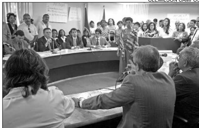
JUSTIÇA - Estado vai voltar a receber financiamentos

É uma ação importante que põe fim a uma demanda existente há alguns anos”, salientou.