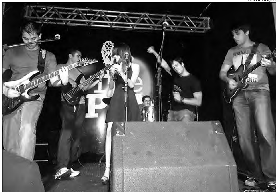
JOHNNY BRAVO - Atração conquistou Prêmio de Melhor Banda de Pop Rock Cover

Com um nome que significa radiação solar refletida em todos os ângulos, a Allbedos busca refletir a musicalidade dos integrantes. Influenciados pelo melhor som dos anos 70 e pelas novas vertentes do rock