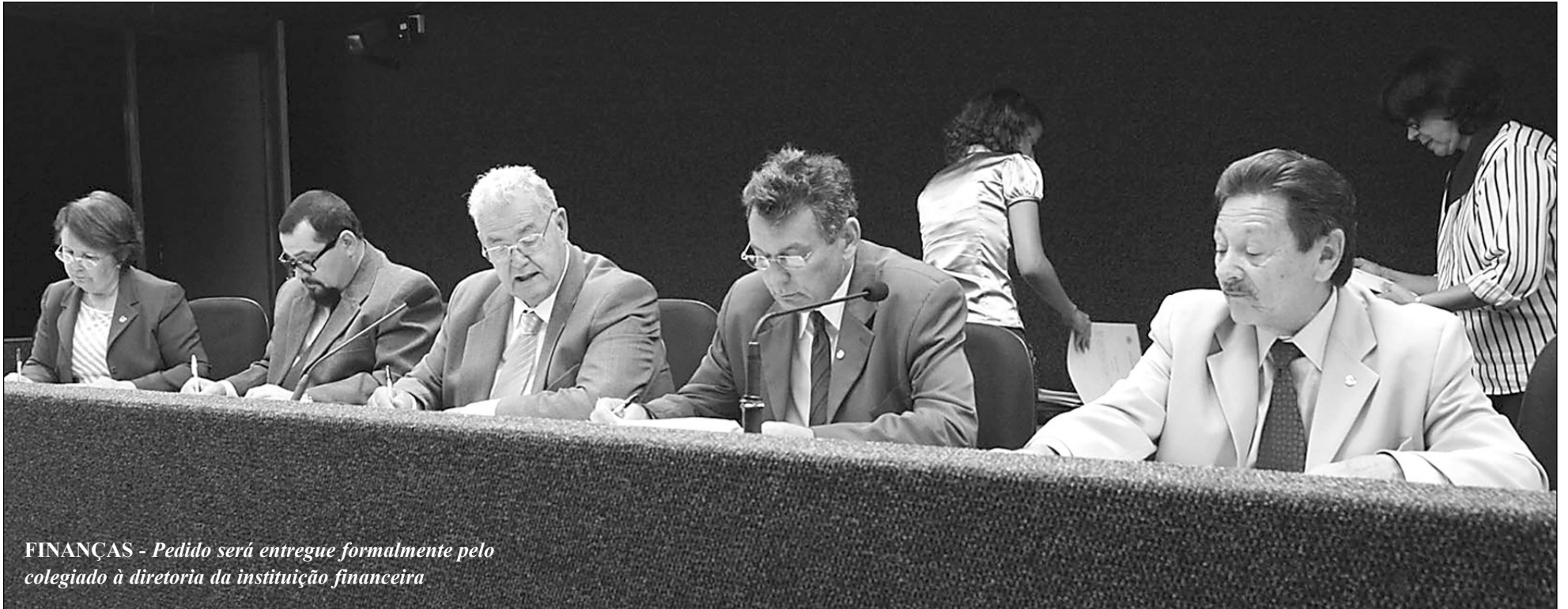
FINANÇAS - Pedido será entregue formalmente pelo colegiado à diretoria da instituição financeira