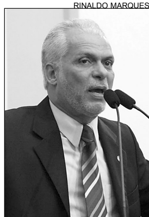
LEITE - Participante

“Durante o encontro, foram apresentadas as medidas definidas nas conferências estaduais e municipais. Pernambuco se destacou porque fez uma das conferências mais organizadas, servindo de modelo para o encontro nacional. O Estado também recebeu elogios por