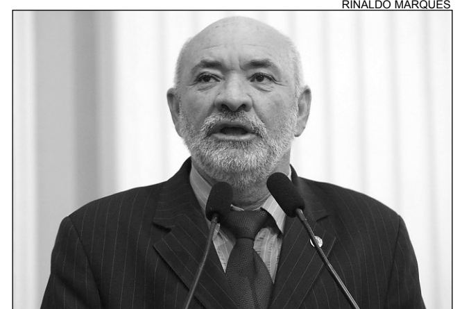
SANTOS - Instalação de lombadas solucionará problema

“É grande o movimento de carros pesados na rodovia, sobretudo, nas proximidades das comunidades de Manoel Chéu e Várzea Grande. As lombadas contribuirão para reduzir a velocidade dos automóveis