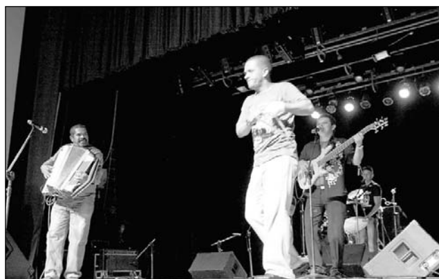
PEGAPAKAPÁ - Grupo de Jaboatão dos Guararapes