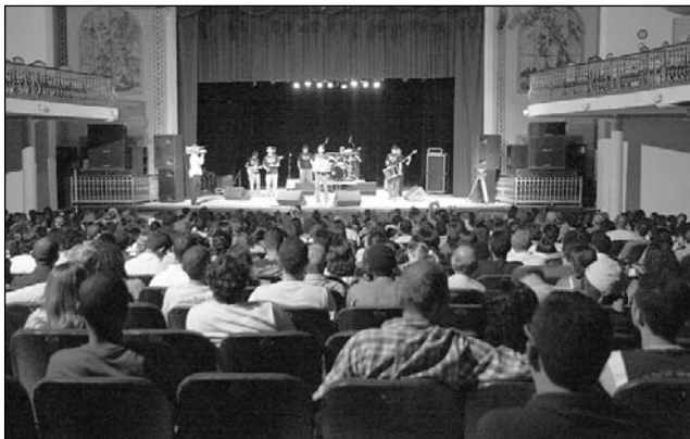
APROVAÇÃO - Público lotou o teatro, na Boa Vista

Teatro do Parque abriu as portas, mais uma vez, para projeto da Assembléia