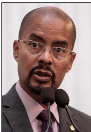
FALHAS - Atendimento

“Às famílias das crianças com microcefalia foi prometido acesso à fisioterapia, fonoaudiologia e terapia ocupacional, mas as sessões duram apenas 20 minutos e são ineficazes”, pontuou Silva. O parla-