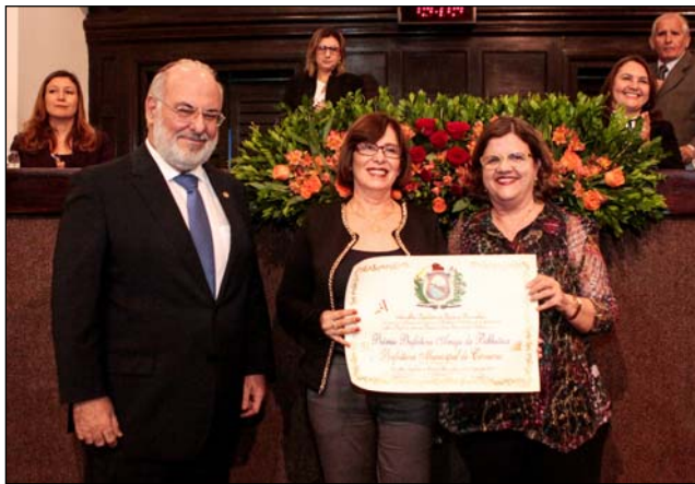
CERIMÔNIA - Secretárias de Educação receberam a honraria, que será ofertada anualmente a dois municípios