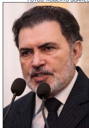
ESTADO - Empenho

O parlamentar criticou, ainda, os gastos do Gover-