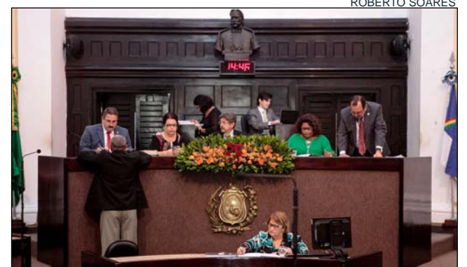
PROPOSTA - Projeto de lei visa dar mais segurança aos passageiros

DOULAS - Também em Primeira Discussão, o Plenário aprovou o Projeto de Lei nº 740/2016, nos termos de seu Substitutivo nº 01, que garante a presença de doulas, profissionais treinadas para dar assistência a gestantes, em estabelecimentos das redes pública e privada de saúde. Segundo a matéria, o trabalho de doulas com certificação ocupacional deve ser permitido sempre que solicitado pela parturiente, embora não seja