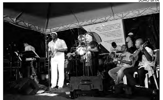
ZÉ POVINHO - Repertório uniu poesia, filosofia e ritmos