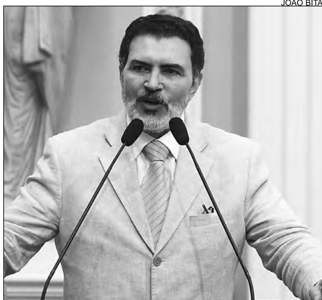
IDEIA - Gel espera que cidades promovam homenagens

Dentre os principais sucessos, Asa Branca , O Xote das Meninas , Olha pro Céu , Riacho do Navio . "Gonzagão defendeu o Nordeste como ninguém", comentou