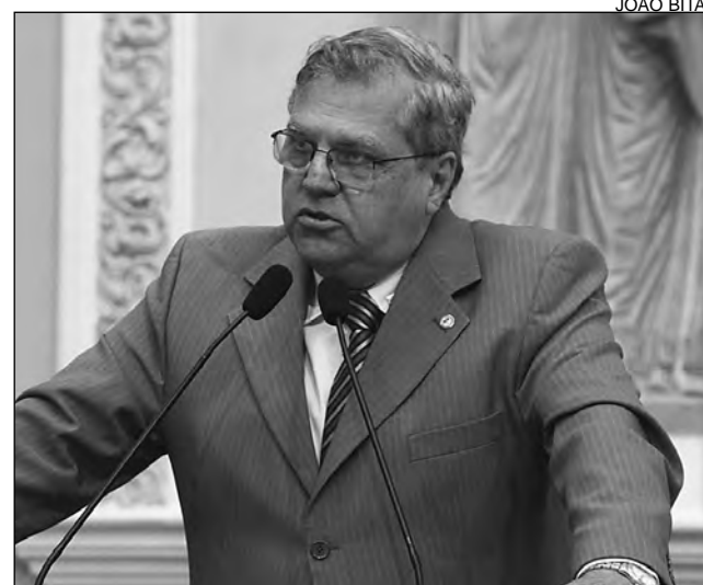
USINA CATENDE - Republicano se mostrou preocupado

O parlamentar também repercutiu a situação da Usina Catende. "Teve início a entressafra e grande parte dos funcionários antigos foi demitida para enxugar a folha de pagamento", lamentou, acrescentando que, este ano, houve diminuição da quantidade de cana de açúcar colhida, de 400 mil toneladas para cem mil. "Dessa forma, a Usina depende da cana de fornecedores e de assentados independentes", explicou. A preocupação do republicano o