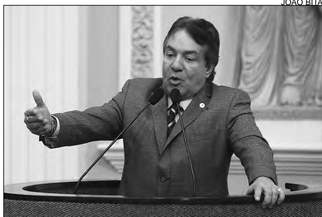
CRESCIMENTO - Izaías Régis elogiou modelo adotado

A necessidade de implantar um grupamento do Corpo de Bombeiros em Garanhuns, no Agreste pernambucano, a fim de melhorar a prestação de serviços, ganhou destaque no discurso do deputado Izaías Régis (PTB), durante a reunião plenária de ontem. O petebista defendeu que a iniciativa visa ampliar a assistência aos municípios da região. "Poderia também ser instalada, na antiga cadeia pública de Garanhuns, uma unidade do Expresso Cidadão, no sentido de facilitar a emissão de documentos e garantir a cida-