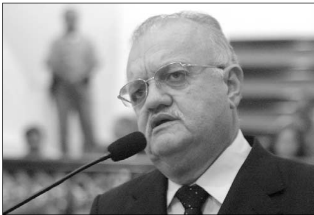
UCHOA - Destaque para o nº de propostas de parlamentares

A Assembléia Legislativa de Pernambuco encerrou, na tarde de ontem, as atividades do primeiro semestre. De fevereiro a junho, a Casa realizou 75 reuniões ordinárias, uma extraordinária e 17 solenes. No período, 151 projetos de iniciativa do Poder Legislativo, 54 do Executivo, quatro do Judiciário e três do Tribunal de Contas do Estado (TCE) foram encaminhados à apreciação.