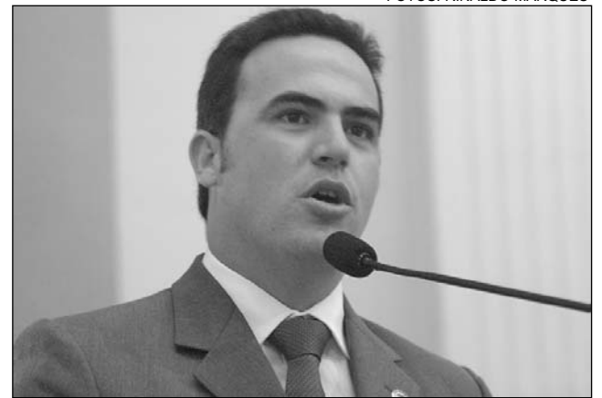
JOÃO - Mesa Diretora luta para pagar URV a servidores

No período, também foi instalada uma Comissão Parlamentar de Inquérito (CPI) para apurar os aumentos tarifários e a qualidade dos serviços prestados pela Celpe e uma Comissão Especial para acompanhar o Plano Estadual da Juventude. Entre os meses de fevereiro e junho, foram apresentadas, ainda, 1.281 indicações e 678 requerimentos.