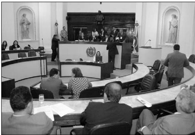
PLENÁRIO - Atividades regulares no dia 1º de agosto

Trinta e quatro das proposições de iniciativa parlamentar tornaram-se lei no semestre, entre elas, a que instituiu o Dia e a Semana Estadual do Idoso e a que dispõe sobre a exploração comercial e o patrocínio de esportes de aventura que envolvam equipamentos de se-